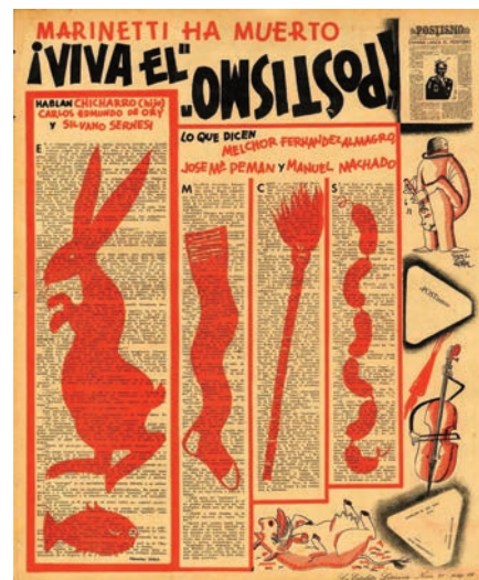
Postismo, Página de la Estafeta Literaria, 1945