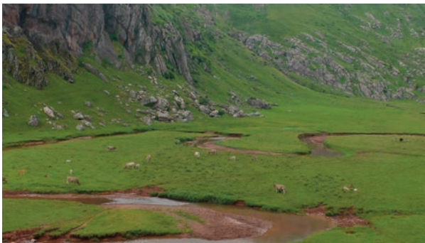
Aguas Tuertas. Ramón Reiné

Se extenderá certificado y valoración si se completa el 85 % de asistencia al curso.